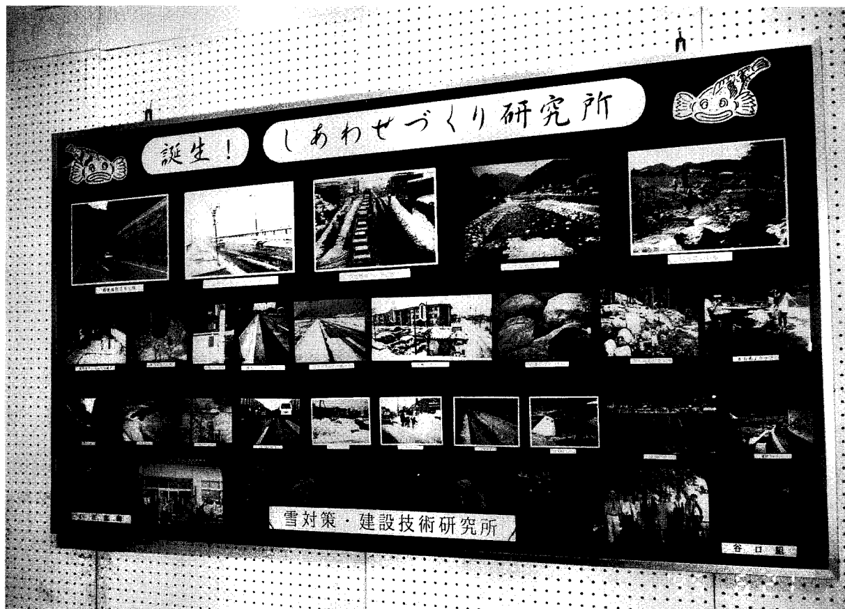
全建写真コンクール銀賞