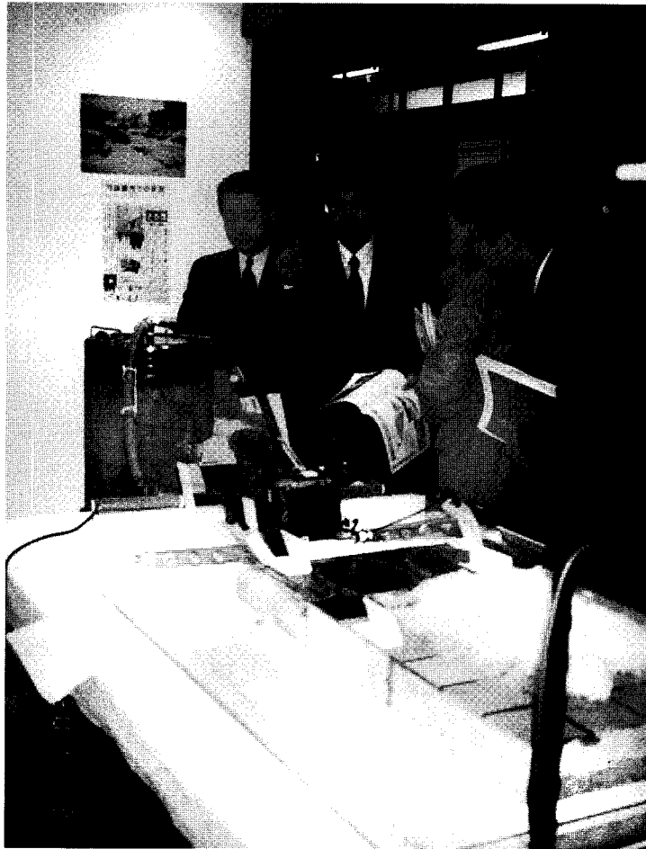
北陸テクノフェア出展(平成6年10月)