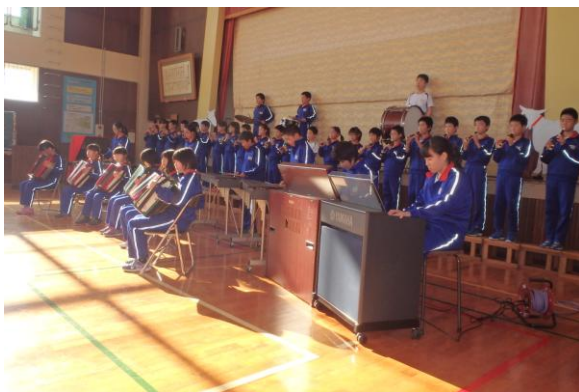
アルプスの少女ハイジの合奏

玄関前で引き渡してもらったやぎを車に乗せてからも、子供たちは車から離れようとせず、出発した車を走って追いかける子供たちもいました。