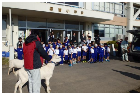
玄関前からお見送り