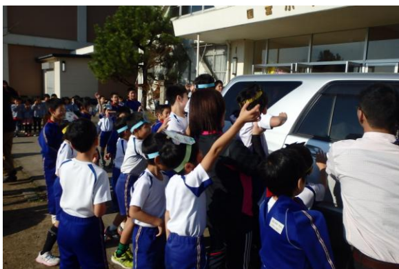
やぎを乗せた車に集まる