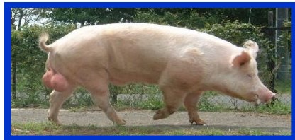
大ヨークシャー(W)種:オス (丈夫でお肉たっぷり)