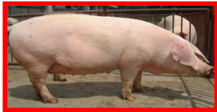
ランドレース(L)種:メス (子沢山で子育て上手)

ふくいポークは下の図のように、3種類の豚を掛けあわせており、畜産試験場では、ふくいポークの父親と母親になる2種類の豚を生産して県内農家に供給しています。