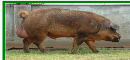
ふくいポーク父豚・デュロク(D)種:オス (肉質に優れている)