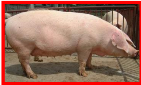
ランドレース (L) 種: メス (子沢山で子育て上手)

ふくいポークは下の図のように、3品種の豚を交配しており、畜産試験場では、ふくいポークの父親(D)と母親(LW)になる2種類の豚を生産して県内農家に供給しています。