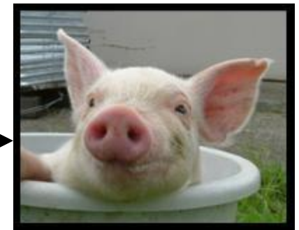
ふくいポーク (LWD) 種