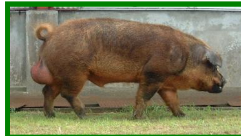
ふくいポーク父豚・デュロック (D) 種 (肉質に優れている) オス