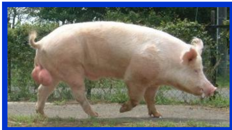
大ヨークシャー (W) 種: オス (丈夫でお肉たっぷり)