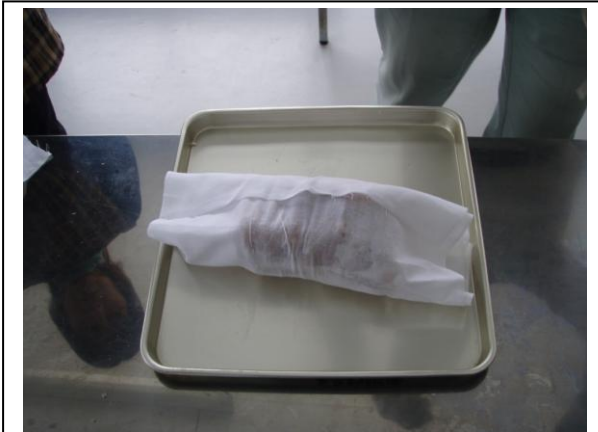
サラシで巻きながら形を整える。