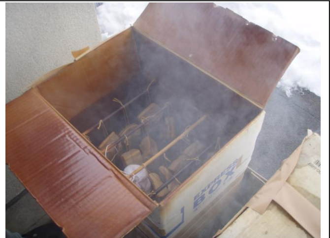
燻煙しているところ。 ベーコンは6時間ほど、 ハムは2時間ほど燻煙する。