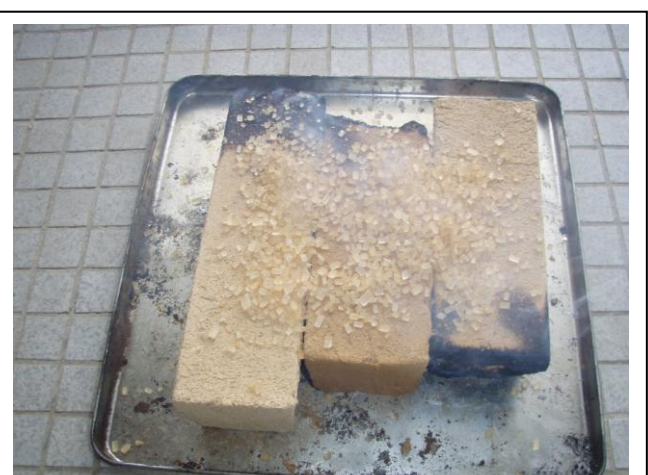
黄ザラメ砂糖をまぶすと、光沢が出る。