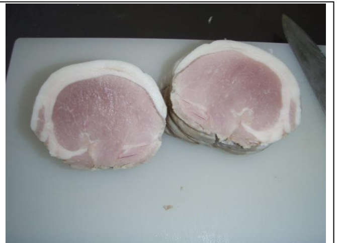
冷蔵庫で1晩冷やせば、できあがり！