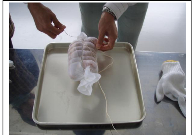
タコ糸で両端を縛ってから、きつめに巻いていく。きつく巻かないとハムになりませんので、要注意！