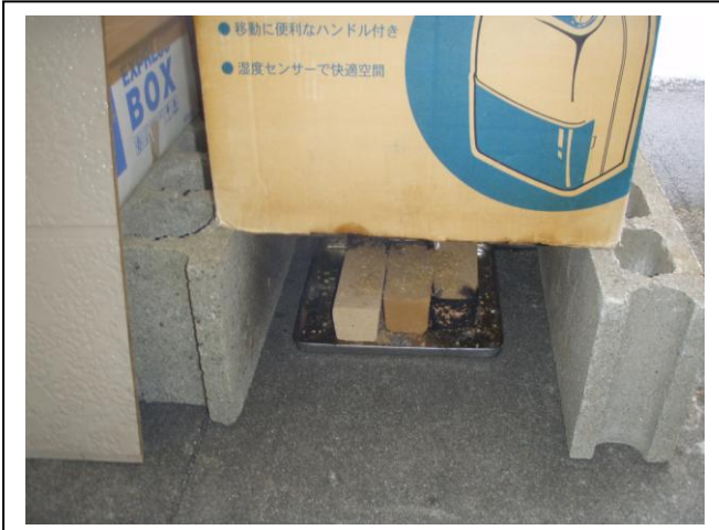
燻煙箱の下にいれ、煙で箱を充満させる。