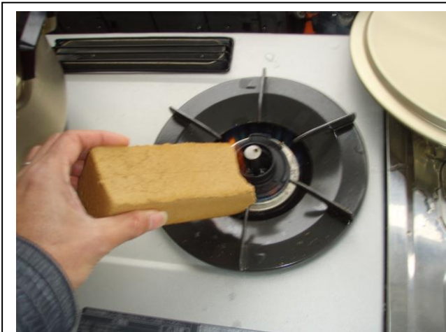
スモーク材の端に火をつけて煙を出す。