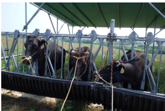
放牧前に駆虫剤をつけます。